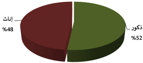
رسم بياني 4. توزيع المتقاعدين المدنيين حسب الجنس كما في 30/11/2019