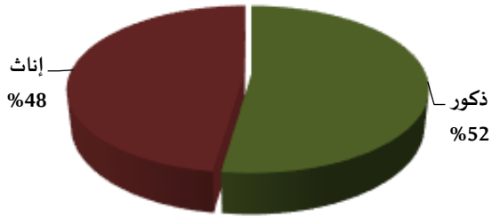
رسم بياني 4. توزيع المتقاعدين المدنيين حسب الجنس كما في 30/06/2020