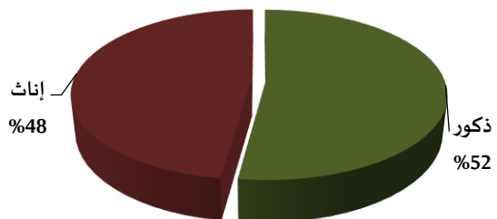
رسم بياني 4. توزيع المتقاعدين (المدنيين) حسب الجنس كما في 30/06/2019